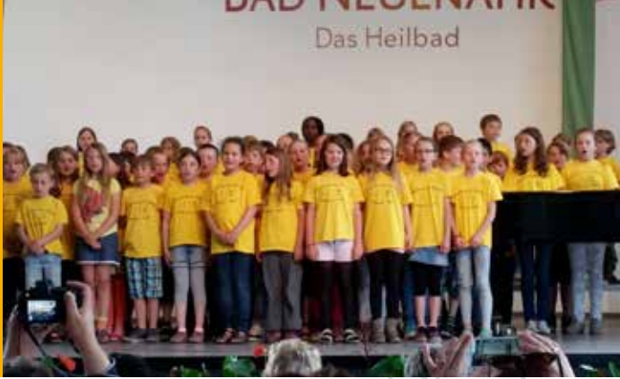
Schulchor in Bad Neuenahr