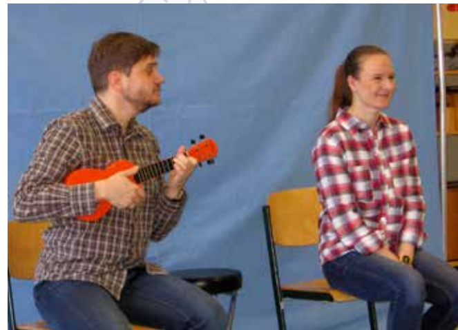
Mein Körper gehört mir